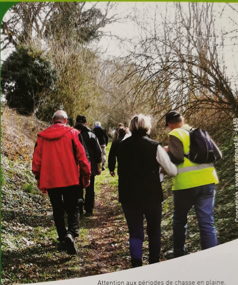
Conception : www.grandnord.fr - 6455

En venant d'Albert prendre la RD 938 en direction de Péronne. Environ 2 km après Fricourt, prendre à gauche direction Carnoy - D254.